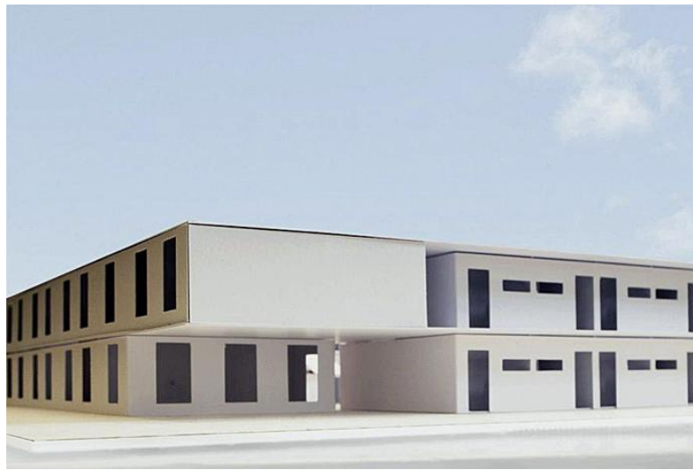
KUNIK DE MORSIER ARCHITECTES

Hébergement d'urgence: comment agir sur le long terme? Conférences et débat le lundi 11 mai à 18 h 30 à l'aula du Collège de Villamont, entrée par l'avenue de Villamont 4, Lausanne. Plus d'infos: www.vd.sia.ch